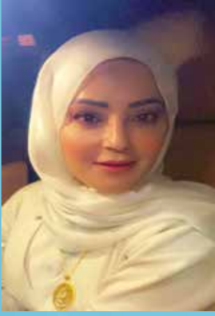
اعداد الدكتورة / فاطمة أحمد المهيلبي طب عائلة