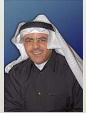
بقلم خبير التغذية يوسف ياسين البناي