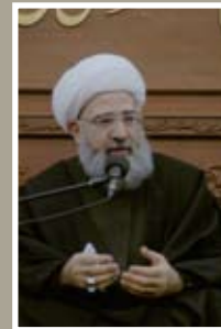
سماحة الشيخ الدكتور فاضل المالكي