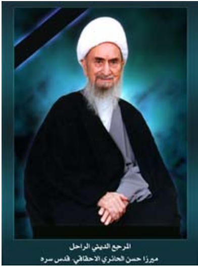
الرجع الديني الراحل ميرزا حسن الخائري الاحقائي - قدس سره

قصه من كتاب رسالة الإنسانية منهج لصياغة الإنسان وفق رسالة السماء تأليف سماحة المرجع الديني الراحل الإمام المصلح و العبد الصالح الحاج ميرزا حسن الخائري الإحقائي - قدس سره