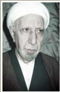
المرحوم الشيخ الدكتور أحمد الوائلي