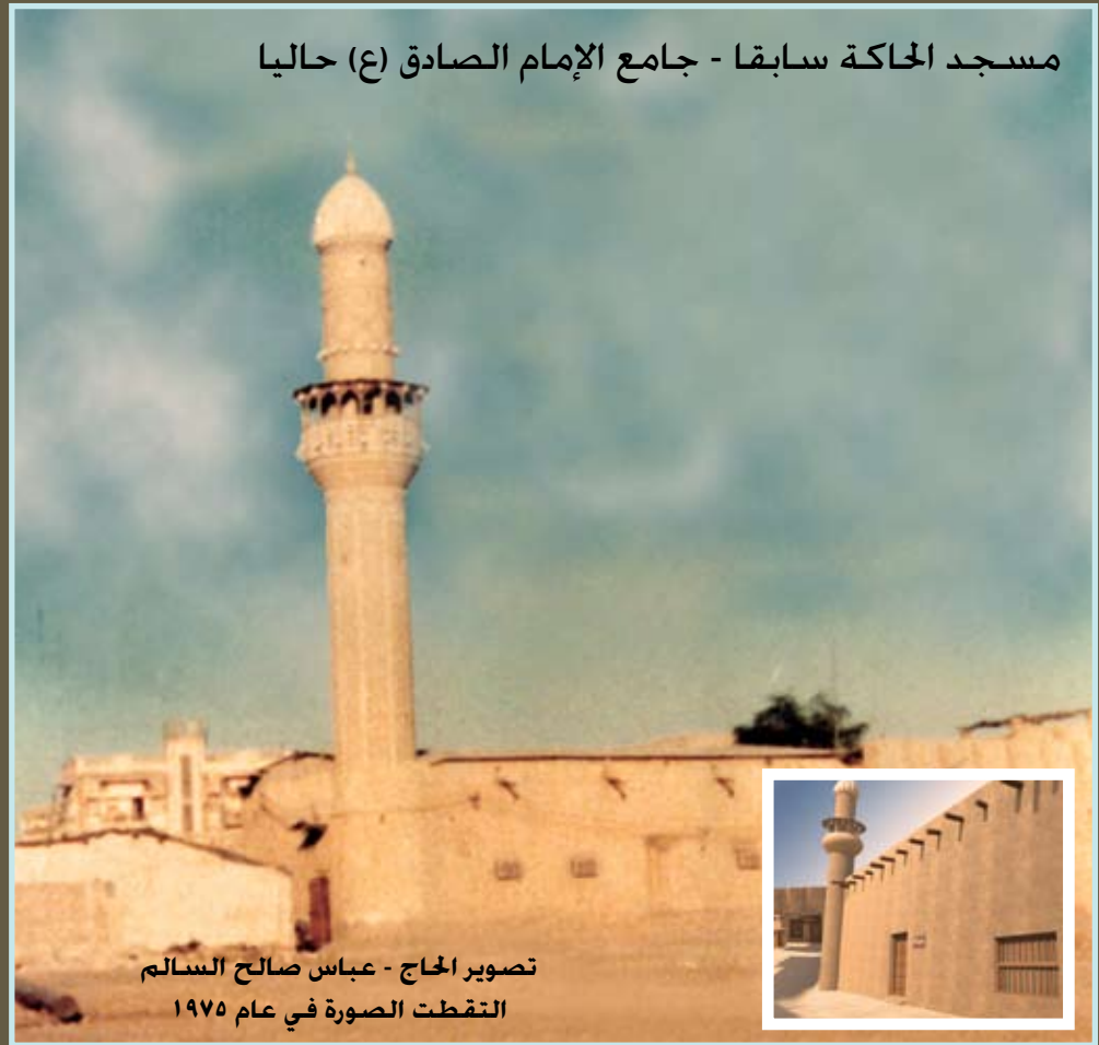
مسجد الحاكة سابقا - جامع الإمام الصادق (ع) حاليا

التقطت الصورة في عام ١٩٧٥